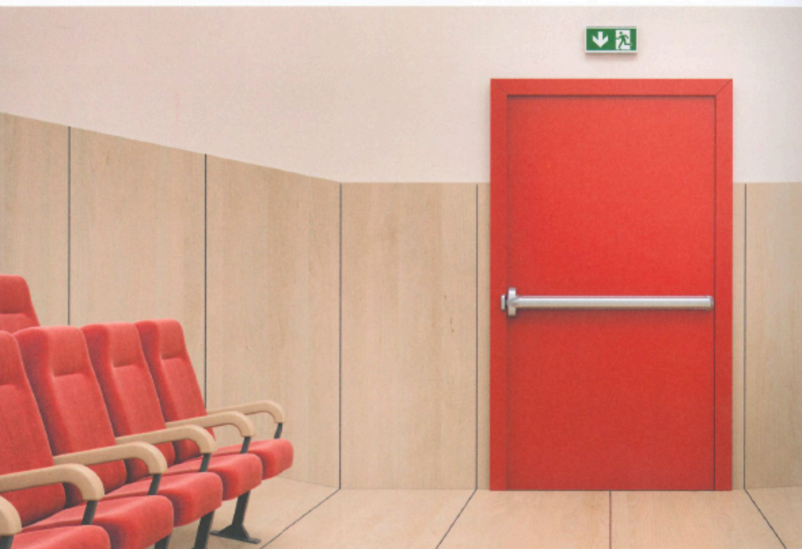
Fapim is de Italiaanse marktleider op het gebied van beslag voor aluminium ramen en deuren. De firma is gevestigd in Altopascio, Lucca.

'Fapim staat synoniem voor hoogwaardig beslag voor aluminium ramen en deuren'